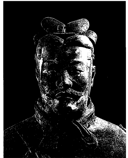
図2. 武将俑 中国・秦（前3世紀）陶高197cm 陝西省 秦始皇兵馬俑博物館蔵