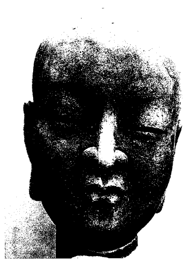
図7. 阿難の首像（複製）テラコッタ用粘土 18×21×33cm 2000年