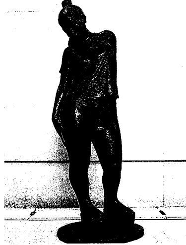
図9. 厚底靴を履く若い女性 FRP 60×45×175cm 2001年