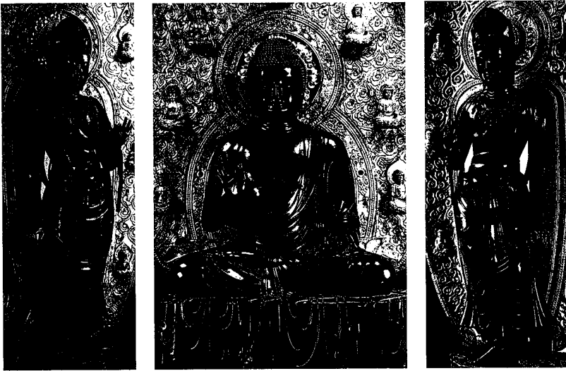
図6. 右脇侍菩薩立像 薬師如来坐像 左脇侍菩薩立像 7世紀末～8世紀初頭 銅 右脇侍高315cm 坐像高255cm 左脇侍高317cm 奈良・薬師寺金堂