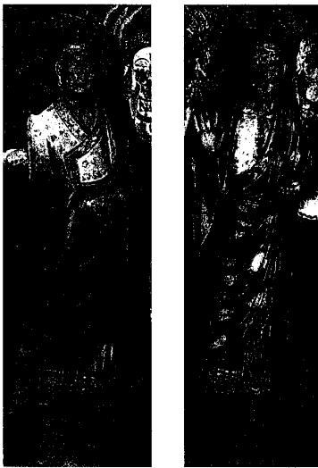
図3. 左阿難像 右迦葉像 中国・盛唐（8世紀前半）塑土 阿難像高175cm 迦葉像高176cm 敦煌莫高窟45窟 甘肅・敦煌県