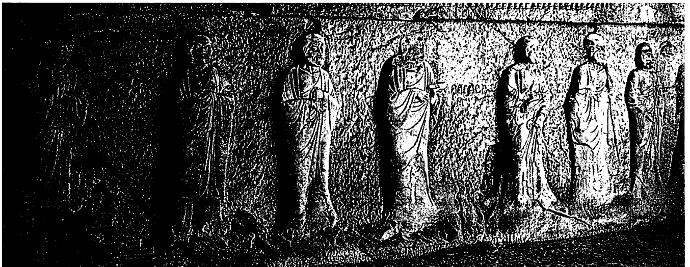
図5. 羅漢像 中国・唐 石 龍門石窟看經洞南壁 高約1,800cm 河南・洛陽市