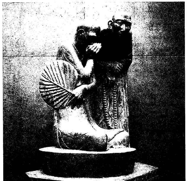
図11. 天機一密室 FRP 121×82×140cm 2002年