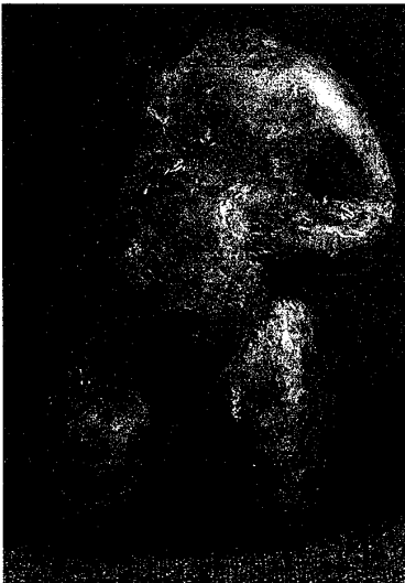
図1. 陶裸体女像 中国・新石器時代