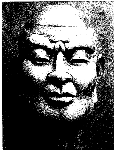
図8. 迦葉の首像（複製） 塑土 25×26×38cm 2000年