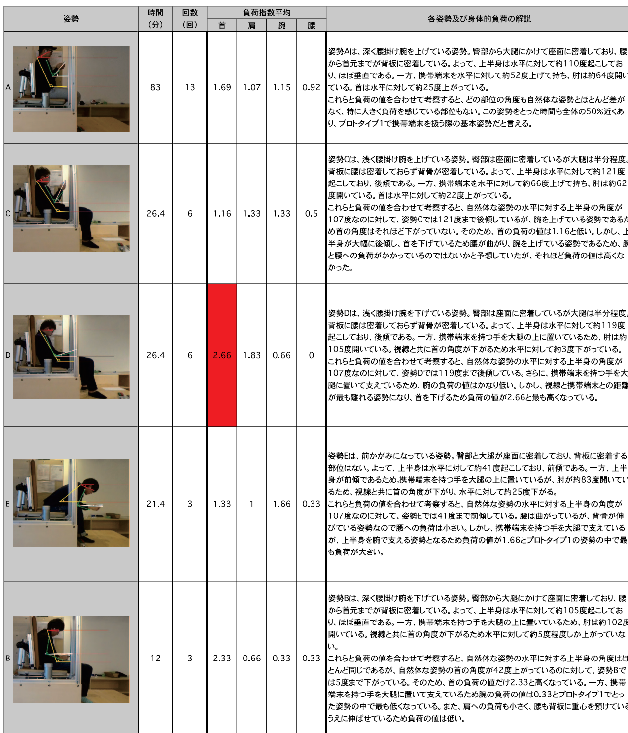
表 2 プロトタイプ 1 の結果および考察

プロトタイプ 6 は、座面前縁高 31.5 cm、座面傾斜角 15 度～25 度、座面奥行 43 cm、背板傾斜角 127 度で、背板にヘッドレストが付いている椅子である。自然体な姿勢の角度は、首 45 度、腰 125 度であった。