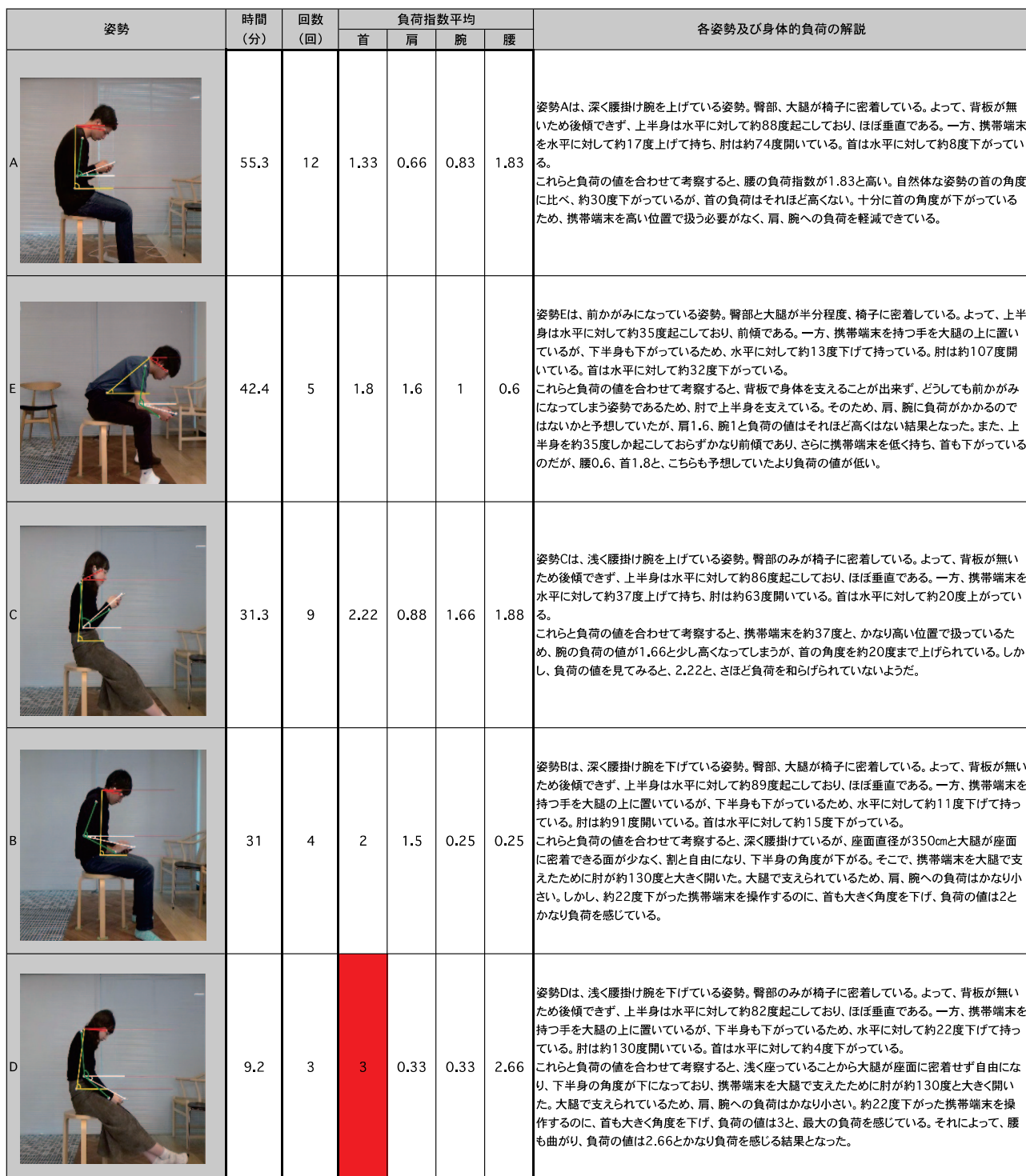
表4 スツールの結果および考察

って負荷を感じる部位にバラつきがあったが、5つの姿勢の中で、被験者が最も多くとった姿勢は A であり、そこでの負荷は多少高いが、部位ごとの負荷のバラつきは少なかった。よって、プロトタイプ1の姿勢 A は、比較的負担の少ない基本的な姿勢であると考えられる。